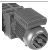
Навесной преобразователь частоты - решение Eta