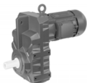
Плоский цилиндрический мотор-редуктор

Диапазон мощности от 0,03 до 45 кВт Диапазон крутящего момента от 20 до 18 500 Нм