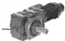
Мотор-редуктор для подвесных конвейеров

Диапазон мощности от 0,03 до 5,5 кВт Диапазон крутящего момента от 25 до 1000 Нм