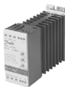
Устройство плавного пуска MCI